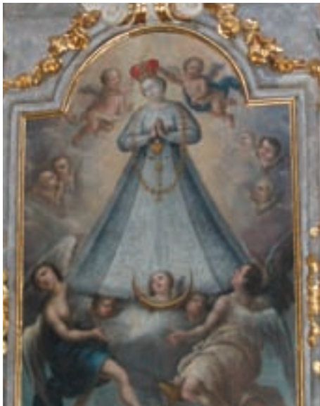
Obr. 25. Panna Maria Vranovská na bočním mariánském oltáři bývalého konventního kostela paulánů v Šamoríně (jižní Slovensko, dnes farní kostel zasvěcený Nanebevzetí Panny Marie). Jedná se o tzv. multiplikaci (šíření, násobení) úcty.