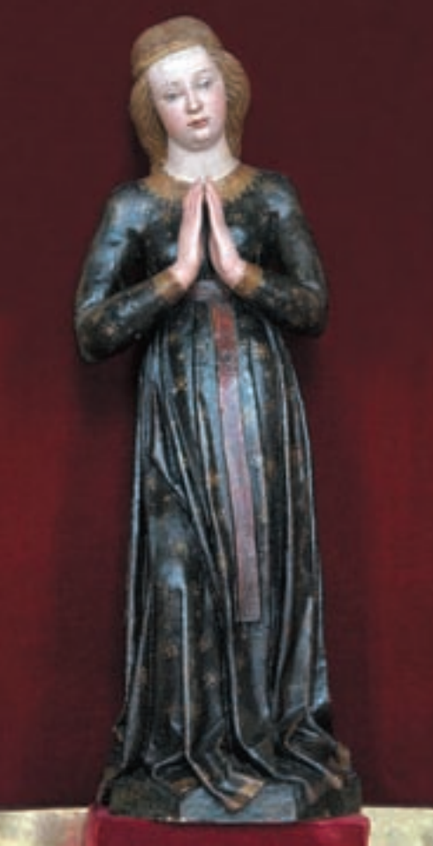
Obr. 8. „Beata gratia“. Pozdně gotická polychromovaná dřevěná soška Panny Marie Vranovské – originál v konventní kapli. Jedná se o typ Panny Marie Klasové.

Brzy po úspěšném odražení švédské přesily v srpnu 1645 vykonali děkovnou pouť na Vranov stateční obránci Brna, v čele s jezuity. Zahraniční účast na vranovských poutích reprezentovali zejména dolnorakouští poutníci, poněkud přicházející z Poysdorfu a okolních obcí. Ti přicházeli poprosit a následně také poděkovat za ochranu svého města před morovými epidemiemi.