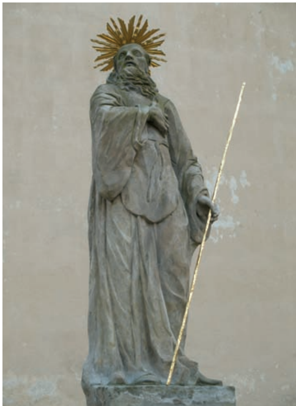
Obr. 19. Socha sv. Františka z Pauly před vstupem do kláštera.