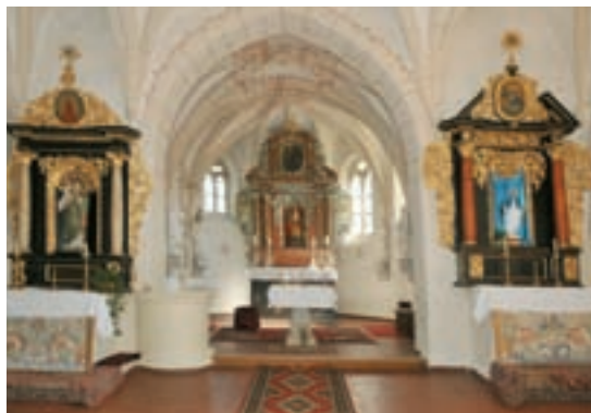
Obr. 30. Interiér kostela sv. Kateřiny.

Gotický kostel sv. Kateřiny ve stejnojmenné obci, se nachází nedaleko od Vranova. Byl vystavěn v 15. století. Na dřevěné, do poloviny zděné věži jsou zavěšeny dva zvony ze 17. a 20. století. Sv. Kateřina byla také vyhledávaným poutním místem. Větší počty poutníků sem proudily zejména v 17. století. Duchovní správu zde pauláni zajišťují také v současnosti.