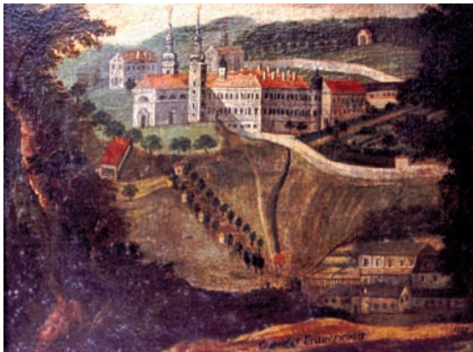
Obr. 22. Olejomalba vranovského konventu od neznámého autora z roku 1775.