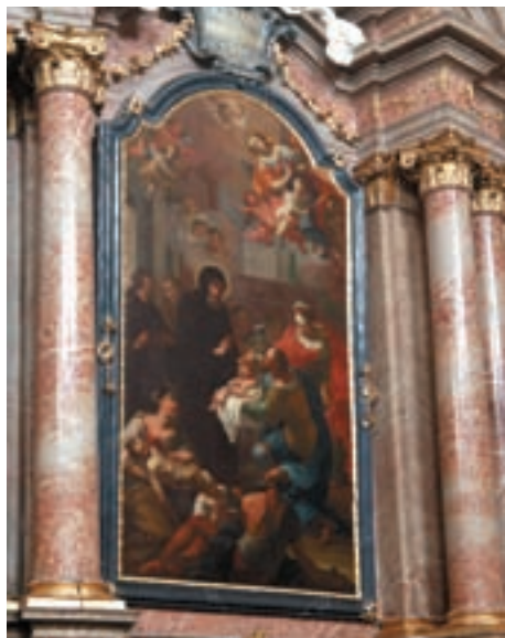
Obr. 5. Oltář sv. Františka z Pauly, zakladatele řádu paulánů, ve vranovském kostele. Světec je zobrazen při zázračném uzdravování nemocných. Další obrazy z jeho života zdobí oblouky nad celkem šesti bočními oltáři.