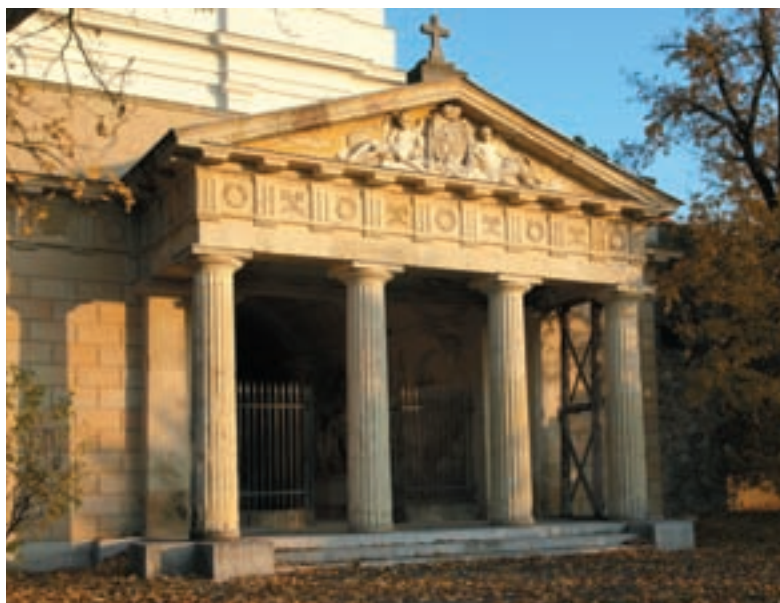
Obr. 14. Klasicistní vstup do rodové hrobky Lichtenštejnů.