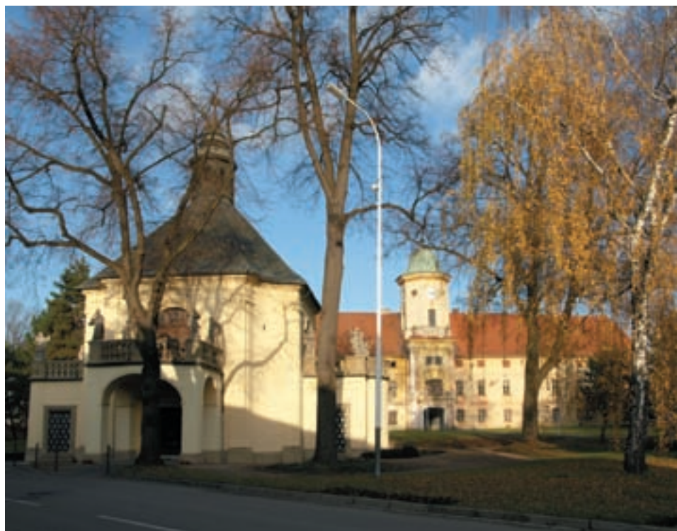
Obr. 27. Barokní kaple sv. Martina před paulánskou rezidencí, náležející až do roku 1784 vranovskému konventu.

navždy postupujeme své panství Mořice se vsí téhož jména a další vsi k němu náležející “. Jednopatrová zámecká budova se středovou věží, zakončenou střechou ve tvaru přílby, s hladkou fasádou, pravoúhlými okny a sedlovou střechou vznikla koncem 17. století kousek od místa, kde stála tvrz, která zanikla za třicetileté války. O dění v Mořicích v průběhu 17. století