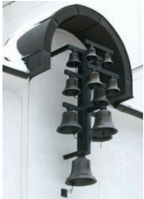
Obr. 26. Vranovská zvonkohra