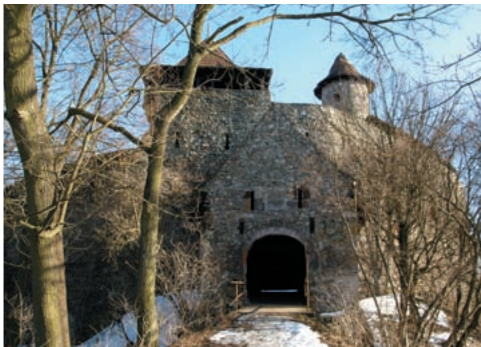
Obr. 33. Pohled na impozantní vstup do Nového hradu u Blanska, v jehož zdech hledali roku 1645 pauláni spolu s dalšími obyvateli okolí útočiště.

správy panství. Ve třicetileté válce sloužil jako důležitý opěrný bod a útočiště pro obyvatelstvo blízkých obcí. Roku 1645 ho dobyli Švédové. Poté, co ztratila opodstatnění jeho obranná funkce, sloužil k ubytování knížecích myslivců. Na počátku 19. století na něm Lichtenštejnové provedli historizující úpravy (přibyla osmiboká věž aj.) a využívali jej jako základnu pro své lovecké pobyty. Úpravy a konzervace torza hradu pokračují i v současnosti. Odlehlost od civilizace přitahuje nejen turisty, ale i filmaře. Natáčel se zde historický film V erbu lvíce, přibližující osobnost svaté Zdislavy.