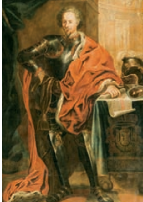
Obr. 3 a 4. Zakladatelé raně barokního poutního kostela Narození Panny Marie a paulánského kláštera ve Vranově u Brna: Kateřina Černohorská z Boskovic a její manžel Maxmilián z Lichtenštejna (1578–1643), představitel nejbohatšího rodu na pobělohorské Moravě. Maxmilián, od roku 1623 kníže, byl vojákem, který působil ve službách císařů Matyáše, Ferdinanda II. a Ferdinanda III. Oba manželé konvertovali ke katolické víře roku 1599. K řádu paulánů, který na Vranov uvedli, získali velmi úzký vztah a do rodové hrobky byli pochováni jako paulánští terciáři. Obraz kněžny se nachází na státním zámku Bučovice, obraz knížete je součástí sbírek v Liechtenstein Museum Wien.

Doba vzniku poutního kostela do určité míry relativizuje okřídlené úsloví „inter arma silent musae“ (mezi zbraněmi Múzy mlčí), neboť se stavělo na počátku třicetileté války. Do hrobky umístěné pod kostelem byl jako první roku 1627 pochován Maxmiliánův starší bratr Karel, jeden z nejvlivnějších představitelů pobělohorských Čech. Kromě místa posledního odpočinku fundátorů byla pod kostelní lodí vybudována ještě další krypta, sloužící jako pohřebiště řeholníků. Narůstající počet poutníků si brzy vyžádal vznik kláštera. Duchovními správci vranovské svatyně se s velkou pravděpodobností měli stát jezuité. Jejich působení ve Vranově v roli zpovědníků a kazatelů je připomínáno ještě roku 1631. Do kláštera, založeného