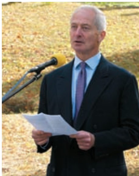
Obr. 18. Jeho Výsost Hans Adam II., vládnoucí kníže lichtenštejnský při své neoficiální návštěvě Vranova v říjnu 2006. Při této příležitosti bylo Kostelní náměstí přejmenováno na Náměstí knížat z Liechtensteina.