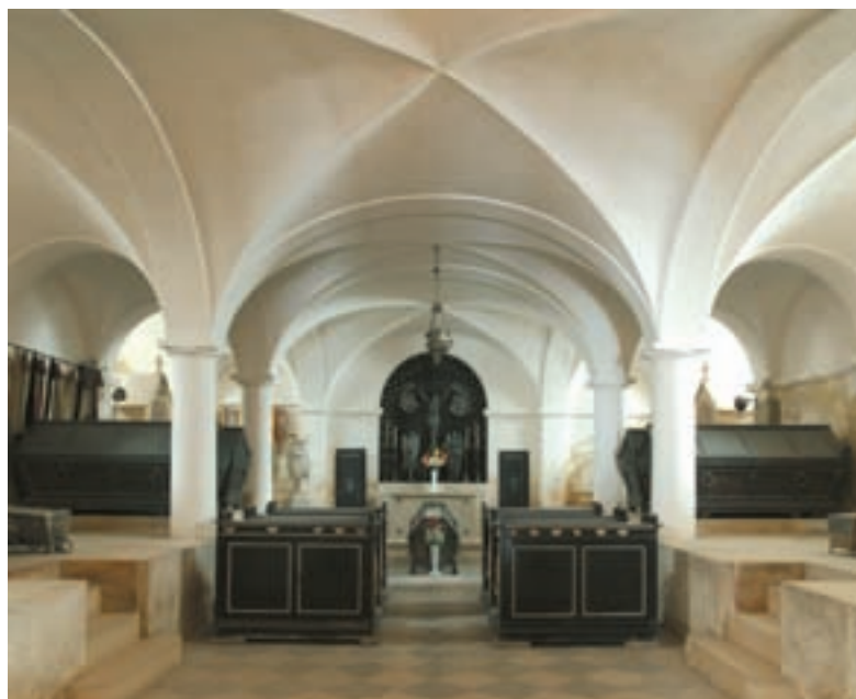
Obr. 15. Pohled do empírového interiéru lichtenštejnské hrobky na Vranově.