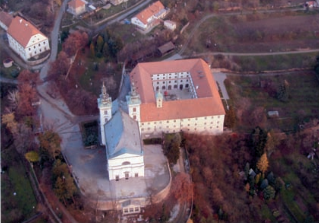
Obr. 21. Letecký pohled na areál poutního místa s klášteřem paulánů a hrobkou Lichtenštejnů.