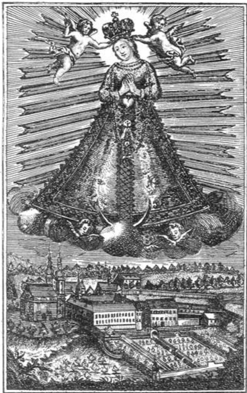
MIRACULOSA. BV. MARIA WRANOVIENSIS