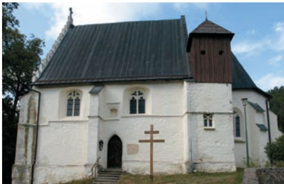
Obr. 29. Celkový pohled na gotický kostel sv. Kateřiny.