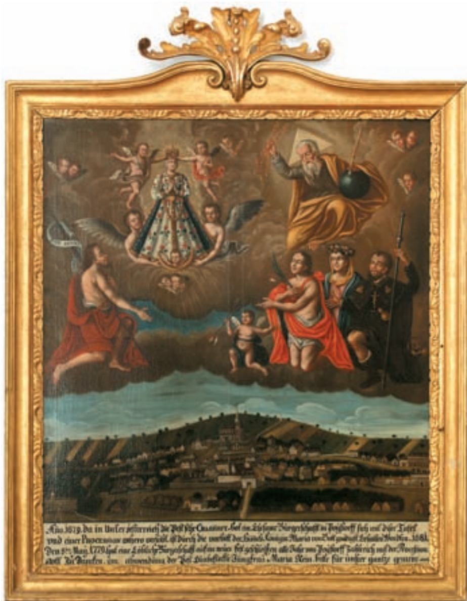
Obr. 10. Votivní obraz věnovaný poutníky z dolnorakouského Poysdorfu. Olejomalba z roku 1779 se nachází ve vranovském klášteře. Text v dolní části obrazu: „Roku 1679, protože v našem Rakousku velmi řádil mor, ctihodné měšťanstvo v Poysdorfu se zaslíbilo s touto tabulí s procesím až sem (putovat), bylo na přímluvu nebeské Královny Marie roku 1681 Bohem nejmilostivěji zachováno. 8. května roku 1770 slavné měšťanstvo znovu pevně uzavřelo (slib) děkovat Bohu za odvrácení moru v hojném počtu s procesím každý rok. Neposkvřněná Panno Maria čistá, pros za celou naši obec.“