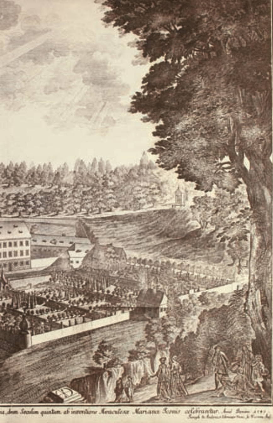
Obr. 12. Celkový pohled na areál paulánského kláštera s poutním kostelem Narození Panny Marie, zahradou, svatými schody, gotickým farním kostelíkem sv. Barbory (je vidět za klášterní kvadraturou). Na poutním kostele je patrná tzv. efemérní architektura, typická pro velké barokní slavnosti. Mědirytina z roku 1740. (Klášter Vranov u Brna).