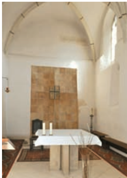
Obr. 32. Presbytář Lelekovického kostela.