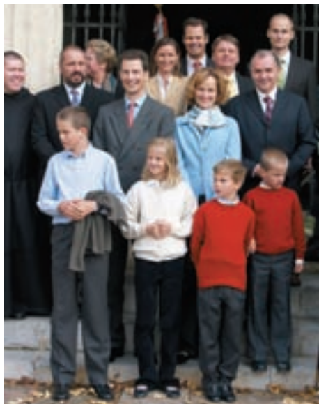
Obr. 17. Korunní princ Alois Filip z Lichtenštejna, úřadující hlava lichtenštejnského knížectví, navštívil roku 2007 Vranov se svojí manželkou princeznou Sofií, rozenou vévodkyní bavorskou a dětmi (na snímku uprostřed a v popředí).