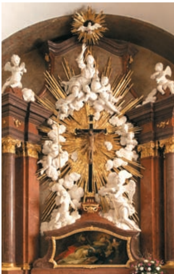
Obr. 9. Kristus na kříži v kapli sv. Rozálie.

Brzy po úspěšném odražení švédské přesily v srpnu 1645 vykonali děkovnou pouť na Vranov stateční obránci Brna, v čele s jezuity. Zahraniční účast na vranovských poutích reprezentovali zejména dolnorakouští poutníci, poněkud přicházející z Poysdorfu a okolních obcí. Ti přicházeli poprosit a následně také poděkovat za ochranu svého města před morovými epidemiemi.