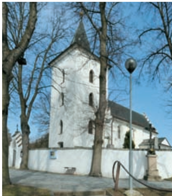
Obr. 31. Románský kostel sv. Filipa a Jakuba v Lelekovicích.

malé zbytky zdiva, odhalené při archeologickém výzkumu. Později byl kostel goticky přestavěn.