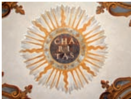
Obr. 6. Znak řádu paulánů