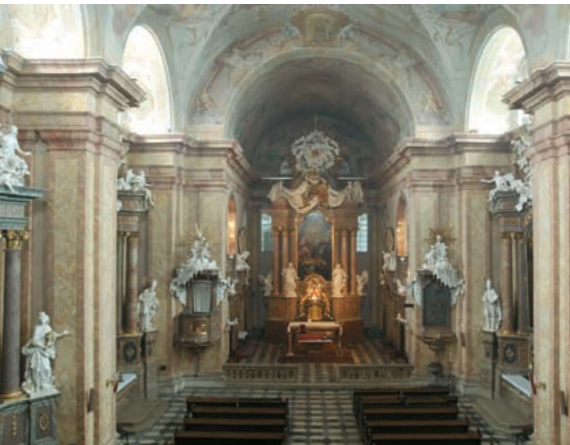
Obr. 11. Interiér poutního kostela Narození Panny Marie. Dnes v něm převažuje výzdoba a vybavení z období kolem roku 1740 a ze 70. a 80. let 18. století.