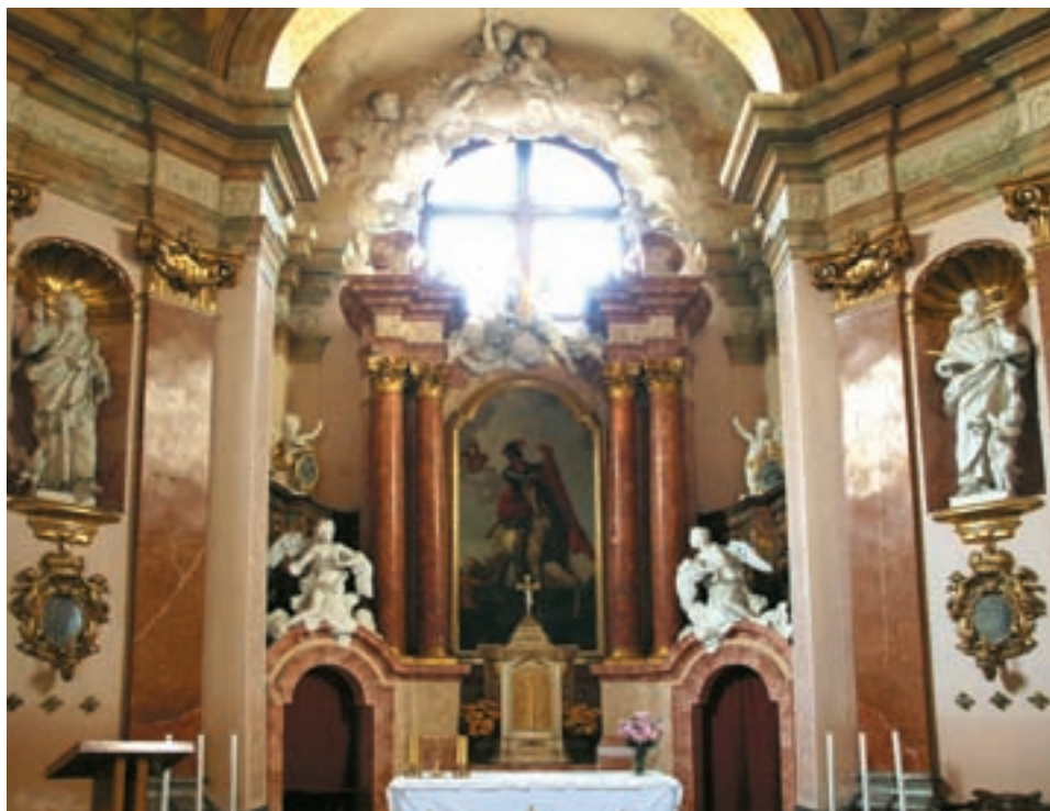
Obr. 28. Pohled do presbytáře kaple sv. Martina v Mořicích. Obraz sv. Martina byl na hlavní oltář vsazen až po zrušení paulánské rezidence.

jsme informováni jen málo, a to především v souvislosti s hospodářskými záležitostmi vranovského konventu. Podrobnější informace k mořické paulánské rezidenci jsou k dispozici teprve od roku 1703, kdy bylo v její blízkosti započato se stavbou barokní kaple. Projekt byl vypracován v duchu architektonické tvorby G. P. Tencally. Stavba však neprobíhala bez komplikací. Dokonce byla 4. července roku 1707 pozastavena z důvodu, že pauláni přesáhli povolené rozměry a stavěli ji nikoliv v rezidenci, nýbrž několik desítek metrů od ní, s vchodem u hlavní silnice procházející Mořicemi. O rok později jim bylo povoleno ve stavbě