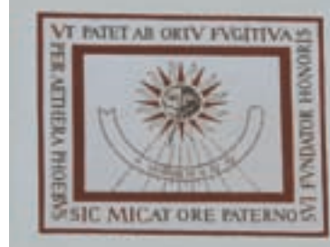
Obr. 23. Sluneční hodiny v prostoru rajského dvora. Příklad barokního nápisu podle A. Weinlicha: „Jak se od východu skrze vzduch spěchajíc jeví slunečko, tak se stkví tváří otcovskou původce cti své.“