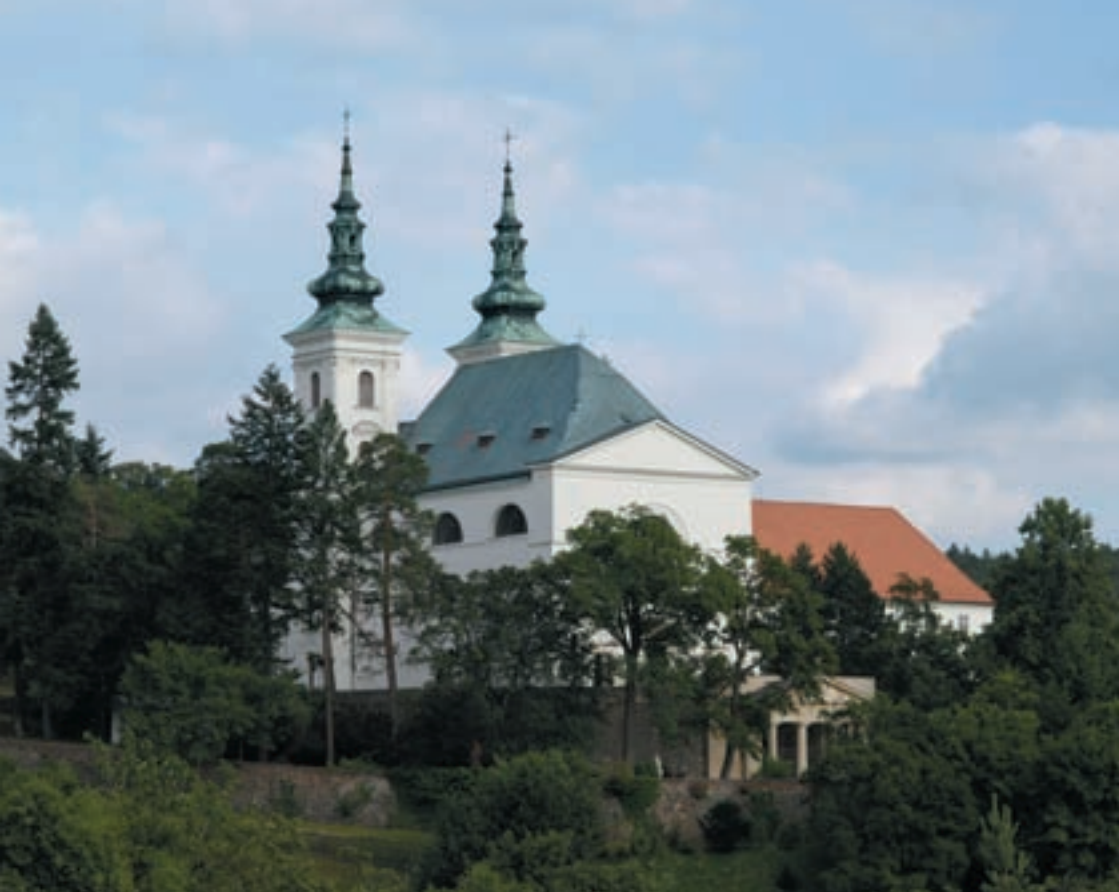
Obr. 1. Celkový pohled na mariánský poutní kostel s paulánským klášterem a hrobkou Lichtenštejnů ve Vranově u Brna.